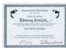
アルジャー・インディペンダンス・ハイスクールの卒業証書

進学合格実績： 東京慈恵医科大、東京医大、山梨大(医)、国際教養大学、東京外大(独)、千葉大(工)、名古屋大(理)、琉球大(国際法政)、東京理科大、慶応義塾大、早稲田大、上智大、ICU、中央大、同志社大、青山学院大、テンプル大、法政大、成蹊大、聖心女子大、獨協大、明学大、関西学院大、フェリス女子大、学習院大、東海大、山梨学院大、東洋英和、学習院女子大、立命館大APU、ICLA山梨学院大、国士館大、神田外大、多摩美大、武蔵野美大、京都造形芸大、京都精華大、南山大学、他多数 Harvard U、New York U、Seattle U、Kansas State U、Pennsylvania State U、UC Berkeley、Berklee Music U、U of London、NU of Singapore、U of Sydney(Australia)、Bond U(Australia)、実践大(台湾)、Sogang U(韓国)、テンプル大(日本)、ミネソタ大(米国)他多数